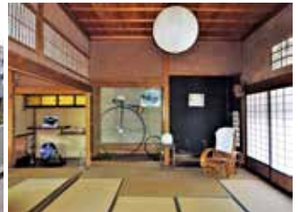
写真／左上1枚 怡顔邸、2枚 保阪邸、下3枚フィリップス邸