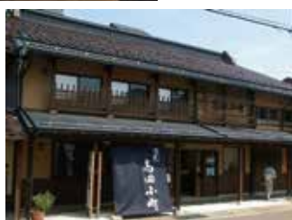
写真／上の右と中央は、会場となる旧今井染物屋。下右は高田小町。