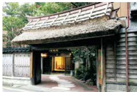
百年料亭 宇喜世／北門（国登録有形文化財）

江戸時代、高田の城下町から生まれた多彩な名産品。そして文化的な名所や、海の幸・山の幸が豊かなまち 上越市。今回は「地産・発見・体験ツアー」として、百年料亭 宇喜世のお食事付きで、ツアーを開催！心も体もリフレッシュするひとときをお過ごしください。